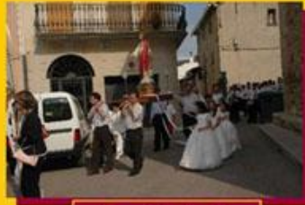
Cor de Jesús