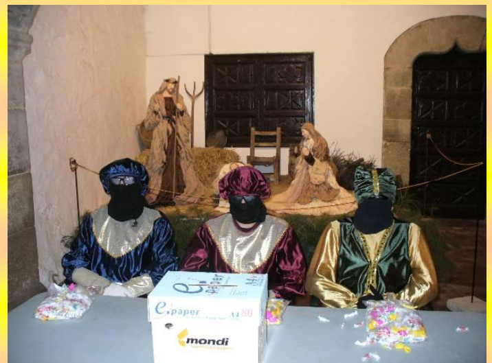
Visita dels patges dels Reis Mags (2009)

El temps de cocció és d'uns quinze minuts. S'ha de servir ben calent com correspon a un deliciós plat hivernal, tot i que no desmereix en cap temporada.