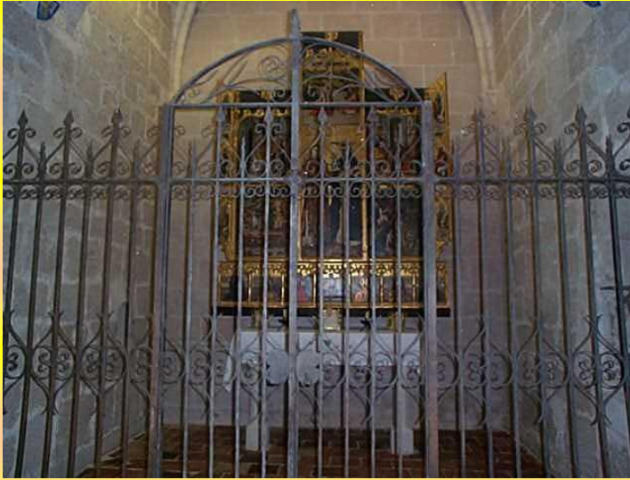
Capella dels Montserrat amb el retaule de Jacomart