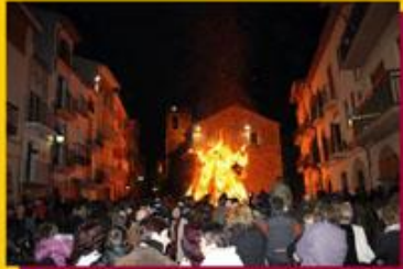
Foguerada Sant Antoni