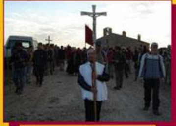
Romeria Sant Pere