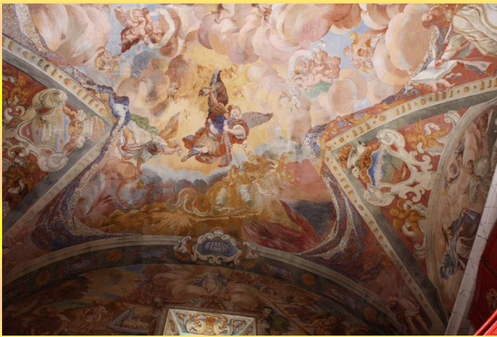
L'arcàngel Sant Miquel en la bòveda de l'ermita de l'Avellà lluitant contra el dimoni (drac)

En l'actualitat, després de 1970, la festa de Sant Miquel es celebra conjuntament amb la de Sant Gabriel i Sant Rafael.