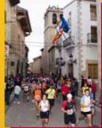
Volta a Catí