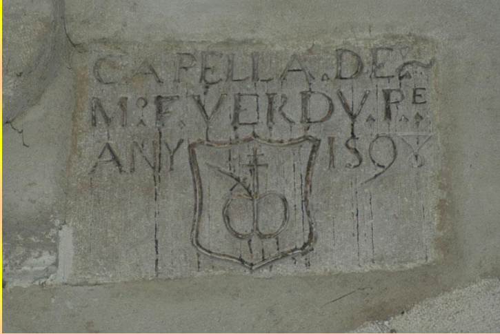
Pedra escut dels Verduns en l'antiga Capella de la Puríssima

Teresa de Jesús traslladant el retaule a la Capella dels Spígol.