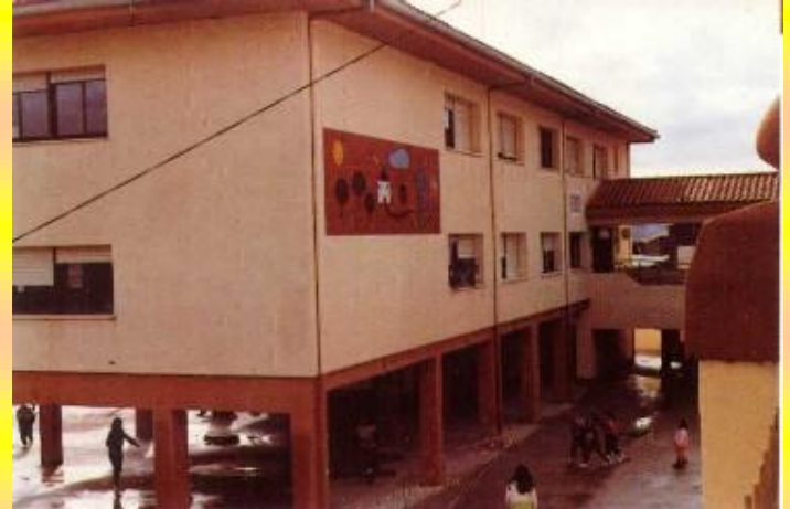
Escola de Catí, abans de la darrera remodelació

obtindre uns diners per organitzar la festa. A les tendes en lloc de diners els solen donar aliments i begudes per a la festa (taronjades, coles, formatge...)