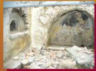
Fer el pa